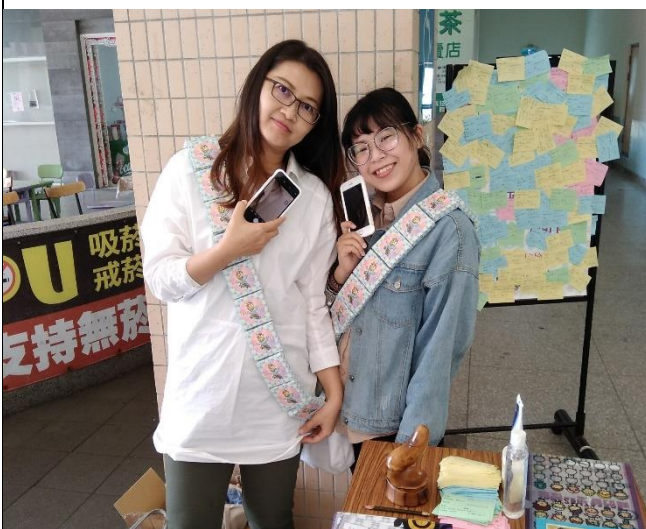
白色情人節:幸福也性福