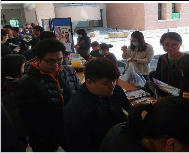
幸福也性福-配合愛滋病匿名篩檢