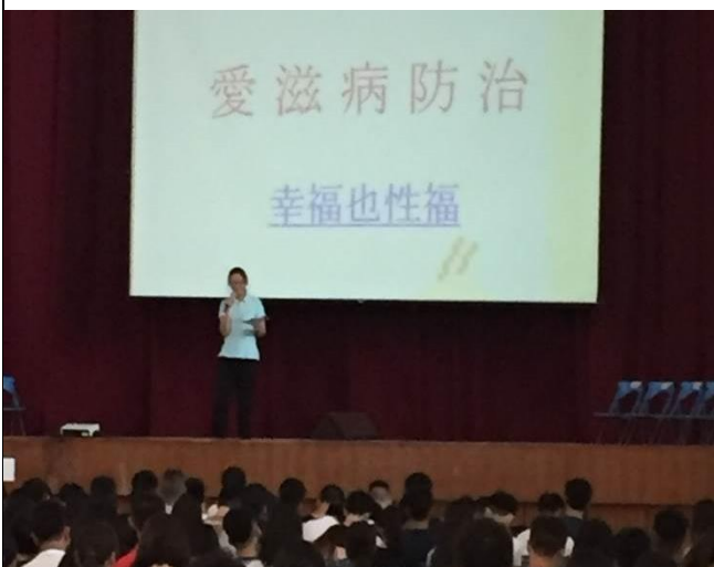
新生訓練宣導愛滋病防治