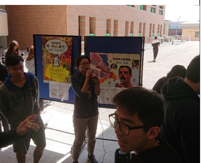
白色情人節:幸福也性福