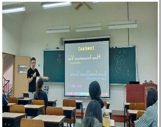
同志諮詢熱線宣導愛滋病防治