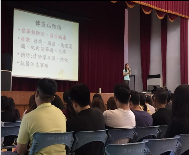
新生訓練宣傳傳染病防治