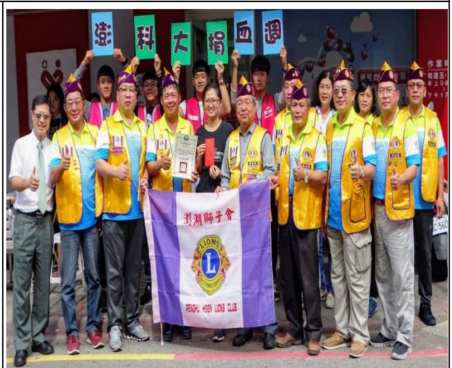
辦理捐血活動宣傳