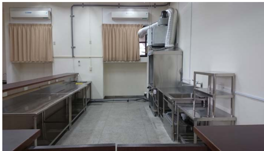
學生餐廳攤位 2 (原 E112 教室)