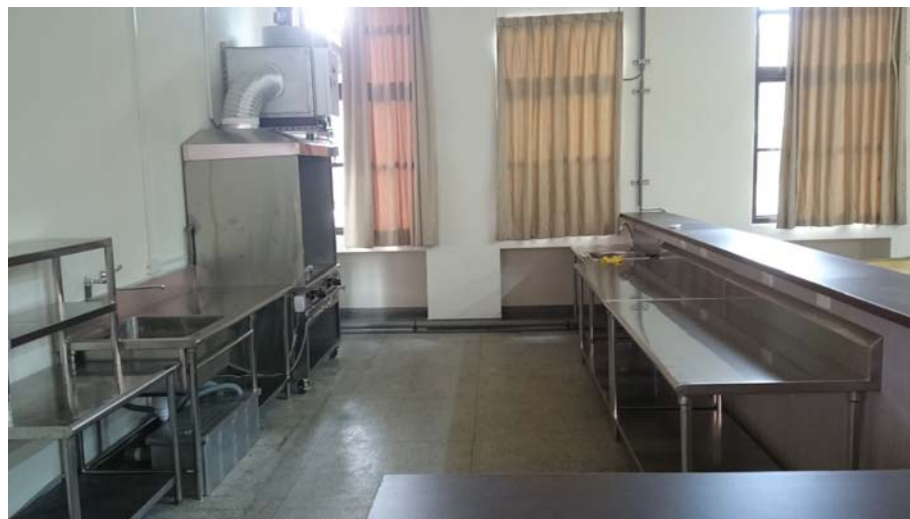
學生餐廳攤位 1 (原 E111 教室)