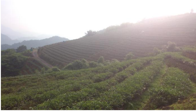
有關坪林老家及茶園照片如下