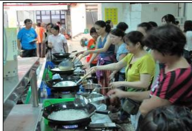
研發處育成中心已於7月24、25日辦理「干貝醬製作教學」研習活動。