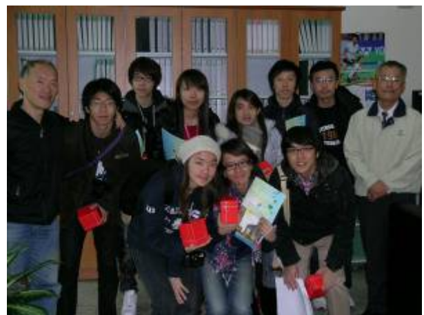
12月30日香港大學9位學生蒞校參訪，參觀本校溫室養殖場與小丑魚等設施。