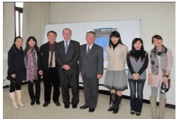
12月20日澳洲商工辦事處蒞校參訪，說明有關學生至澳洲念書優勢與澳洲政府獎學金事宜。