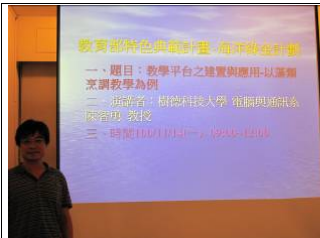
11月14日餐旅系於詠風館辦理「教學平台之應用與建置-以藻類食譜為例」講座，邀請樹德科技大學電腦與通訊系陳智勇教授。