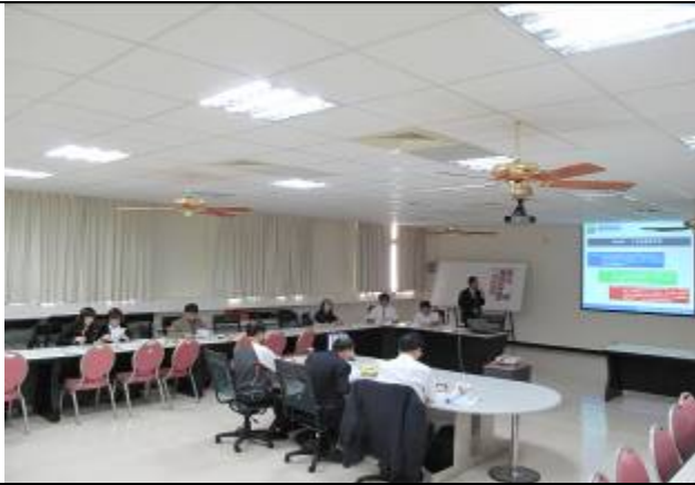
經濟部委員蒞校進行育成中心訪評。