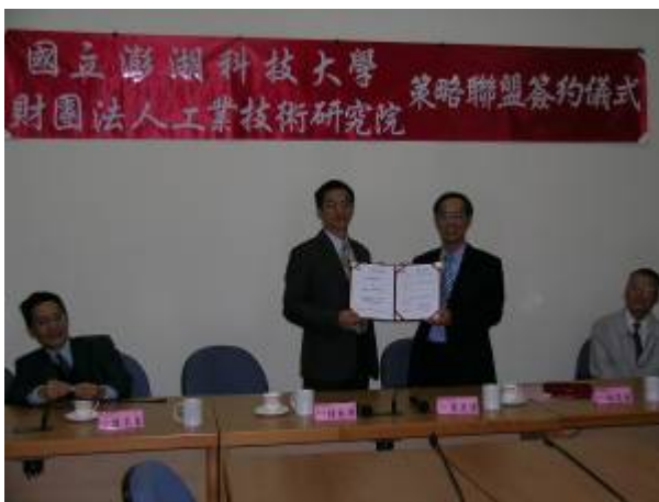
12月28日本校與財團法人工業技術研究院簽訂「太陽光電模組與系統可靠度技術研發合作備忘錄」。