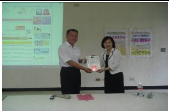
研究發展處於 10 月 15 日假育成中心會議室辦理職訓局就業服務計畫—打造求職金戰袍研習營。