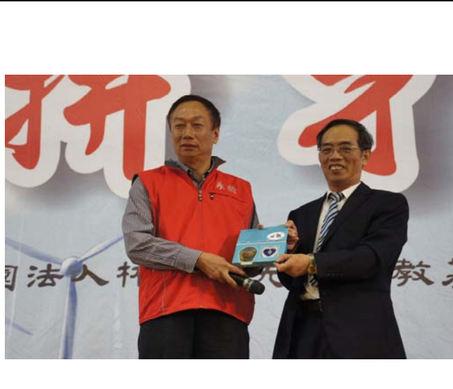
12月14日鴻海精密工業股份有限公司郭台銘董事長蒞校舉辦「我們的未來不是夢—郭台銘與青年朋友對話(要拼才會贏)」座談活動。