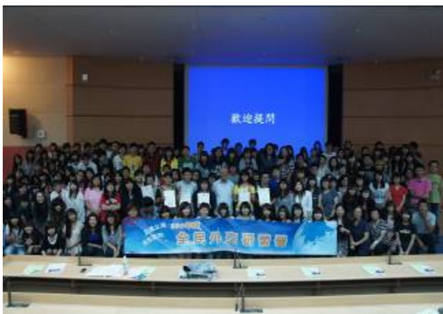
9月15日外交部外交領事人員講習所石定所長等一行蒞校舉辦全民外交研習營。