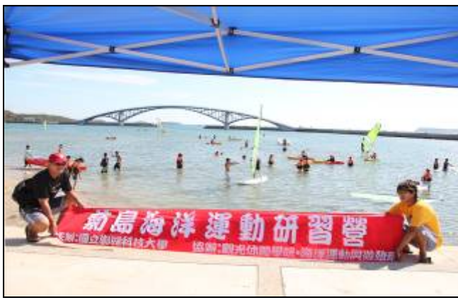
100年7月4日至7月7日觀光休閒學院與海運系舉辦曉明女中菊島海洋運動研習營。