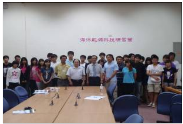
養殖系於7月6日至7月8日辦理海洋能源科技研習營。