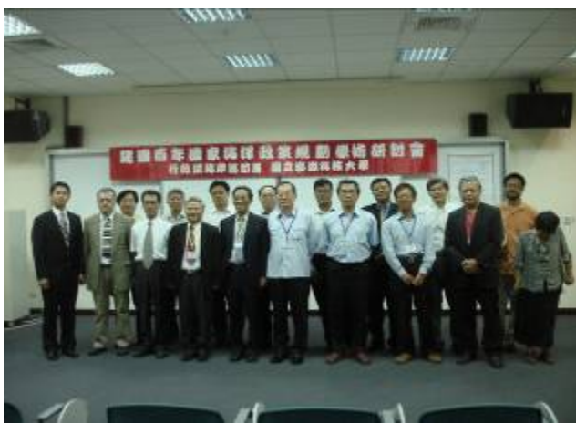
10 月 26 日國立台灣海洋大學李國添校長等蒞校參加建國百年國家海洋政策規劃學術研討會。