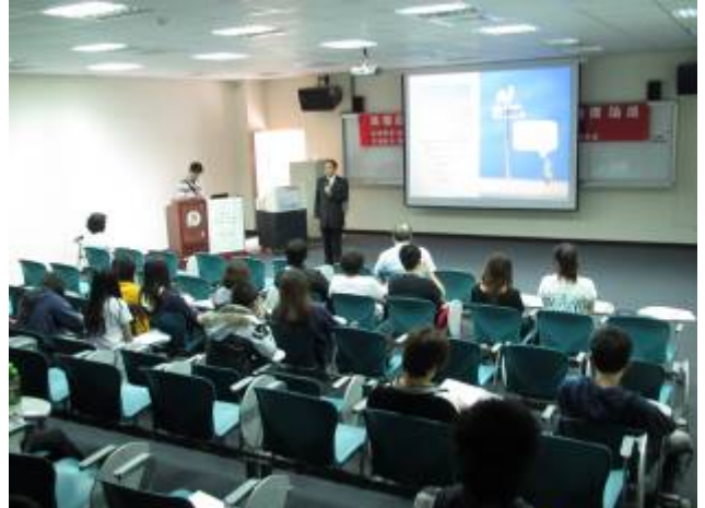
研究發展處育成中心與本校行銷與物流管理系於 11 月 2 日及 11 月 14 日合辦兩場「建國百年企業創新經營管理論壇」。