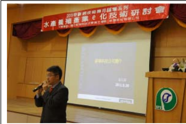
國際知名工業電腦公司研華科技股份有限公司於 9 月 30 日與本校水產養殖系共同辦理養殖產業 e 化研討會。