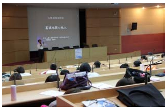
觀休院於10月12日邀請澎湖國家風景區管理處張隆城處長蒞校於院週會專題演講。