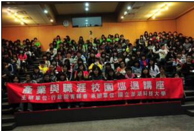
青輔會產業與職涯巡迴講座於 10 月 21 日邀請中國藍負責人來校對應用外語系學生演說。