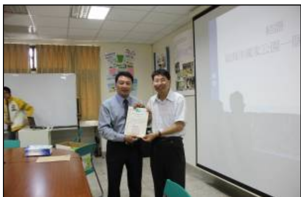
觀休所於100年9月21日邀請澎湖縣農漁局鄭明源局長蒞校專題演講。