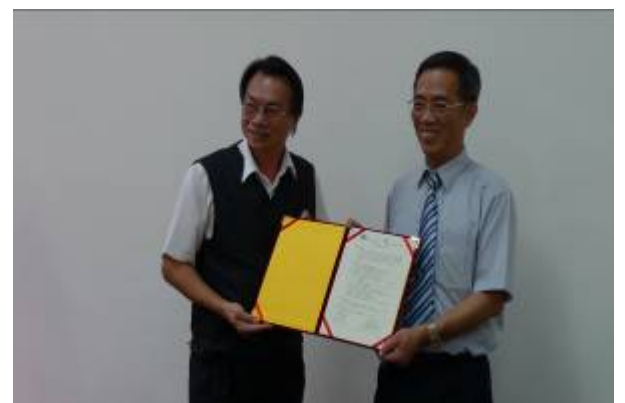
本校與嘉義東石高中於9月16日簽訂策略聯盟備忘錄。