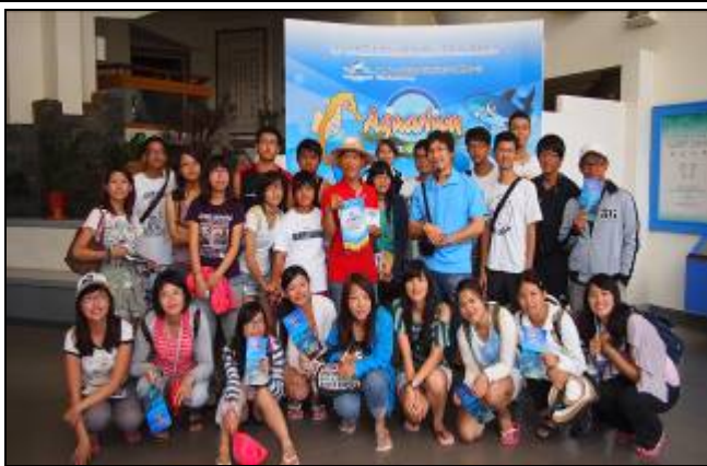
7月12日至7月20日觀光休閒學院與海運系舉辦東海大學博雅書院菊島海洋運動與生態體驗活動。