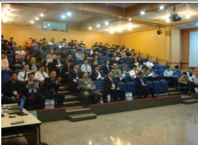
水產養殖系協助台灣水產學會及福建省水產學會於 11 月 30 日在本校舉辦「海峽兩岸現代漁業設施與裝備研討會」。