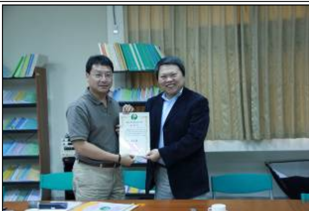
11 月 2 日觀休所邀請教育部周燦德前常務次長蒞校演講。