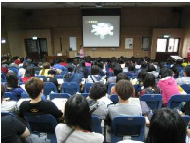
學務處於 10 月 19 日辦理兩場次性別平等教育講座「幸福戀愛講座~我們都值得被珍惜」。