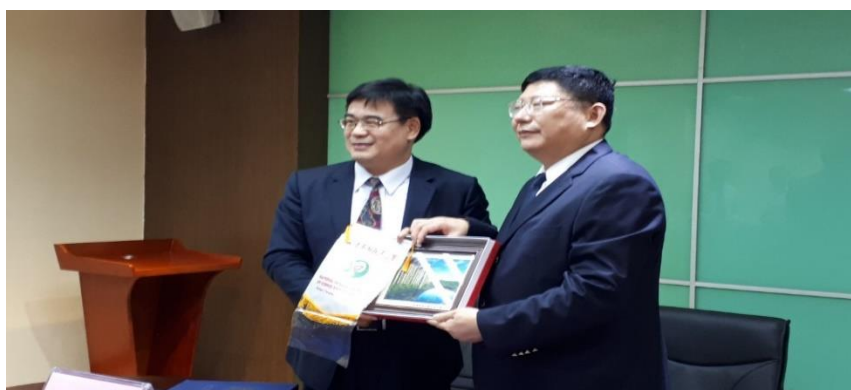
圖：與大陸廣州航海學院簽署兩校合作備忘錄

倍的翻身。大陸當局責承廣州航海學院鄒采容校長籌劃廣州交通大學成立的籌備工作，並將於近兩年正式掛牌成立廣州交通大學。廣州航海學院可能納入廣州交通大學體系。本校與廣州航海學院未來將以學生交換為優先兩校交流策略，並逐漸擴展至教師互訪和共同研究的層級，以建立兩校互利共榮伙伴關係。(秘書室)