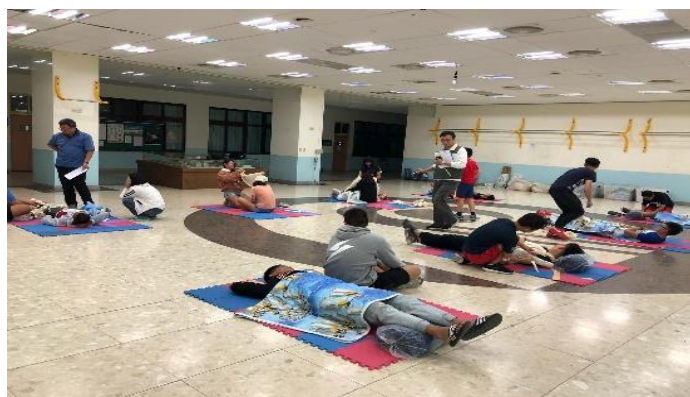
圖:辦理紅十字會急救員訓練活動照

107 年（4 月 14-15 日）本校健康中心協助海運系辦理紅十字會急救員訓練，共計 20 人參加。（學務處）