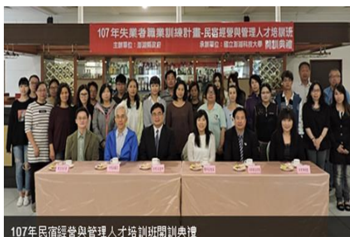
107年民宿經營與管理人才培訓班開訓典禮

107 年（4 月 17 日）本校餐旅系開設民宿經營與管理人才培訓開班。協助失業或待（轉）業民眾學習專業知識與技能應用於民宿業之職場領域，以謀得一技之長順利就業。（進修推廣部）