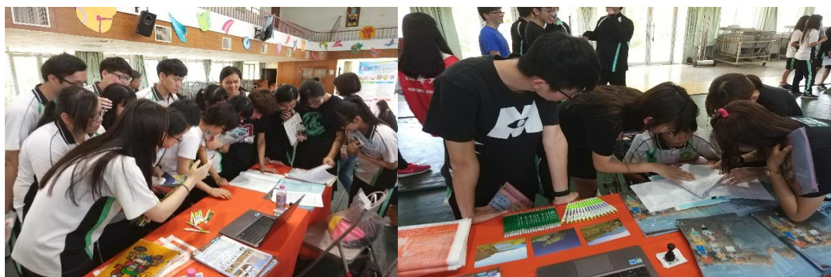
圖：國立曾文家商升學博覽會

107 年(4 月 10—21 日)本校出席臺南崑山高中(4/10)、國立曾文家商 (4/12)、臺南南英商工(4/13)、國立虎尾農工(4/18)與高雄三信家商(4/21)升學博覽會，零距離學生與教師接觸，宣導澎科大各系所教學理念，並拓展學校知名度。(教務處)