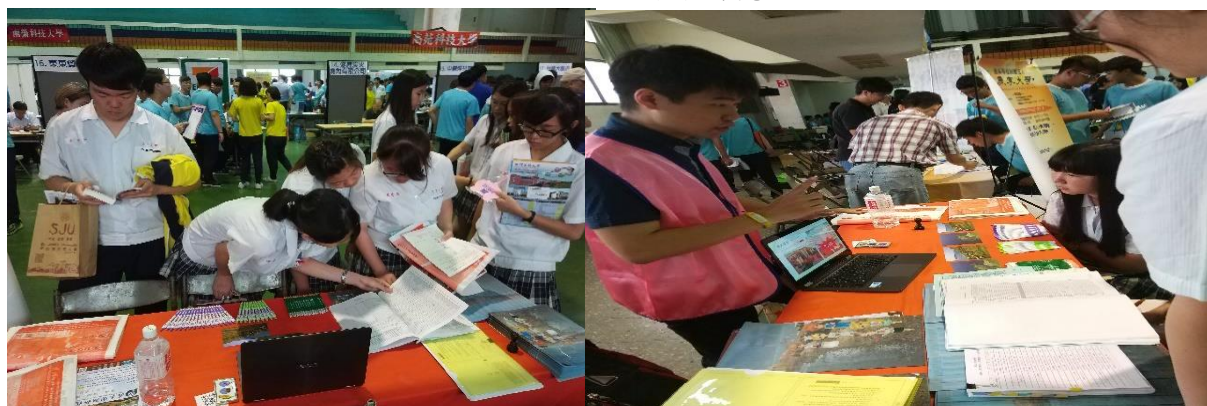
圖：臺南南英商工升學博覽會