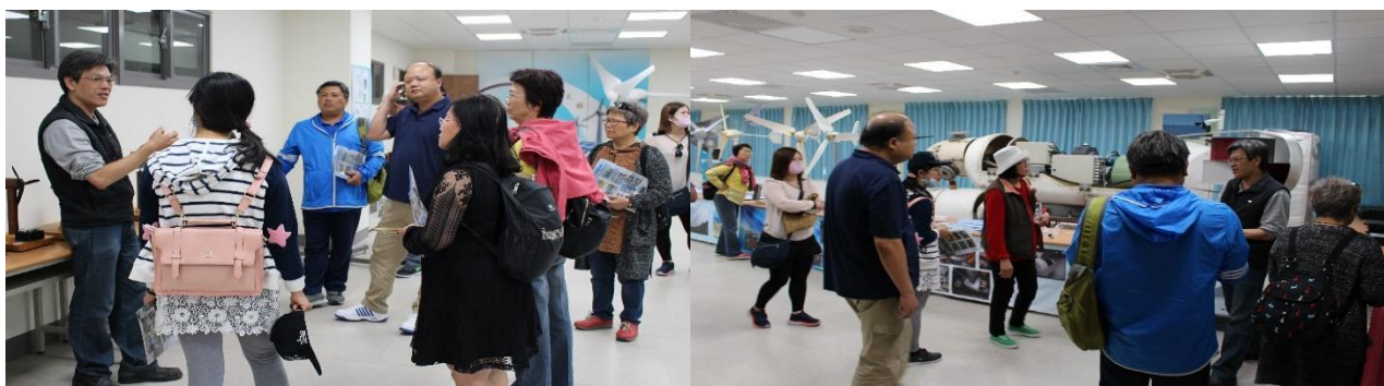
圖：推廣教育非學分班執行澎湖海洋資源環境教育系列課程活動照

107 年（4 月 18 日）本校進修推廣部辦理執行「澎湖海洋資源環境教育系列課程－海洋資源、風光不斷（推廣教育非學分班）」。以澎科大綠能展示館之太陽能及風力資源與學員教學互動，由教學人員帶領學員體驗風車公園，瞭解太陽能及風力資源與人類活動的關係及因環境變遷的生活改變與影響。（進修推廣部）