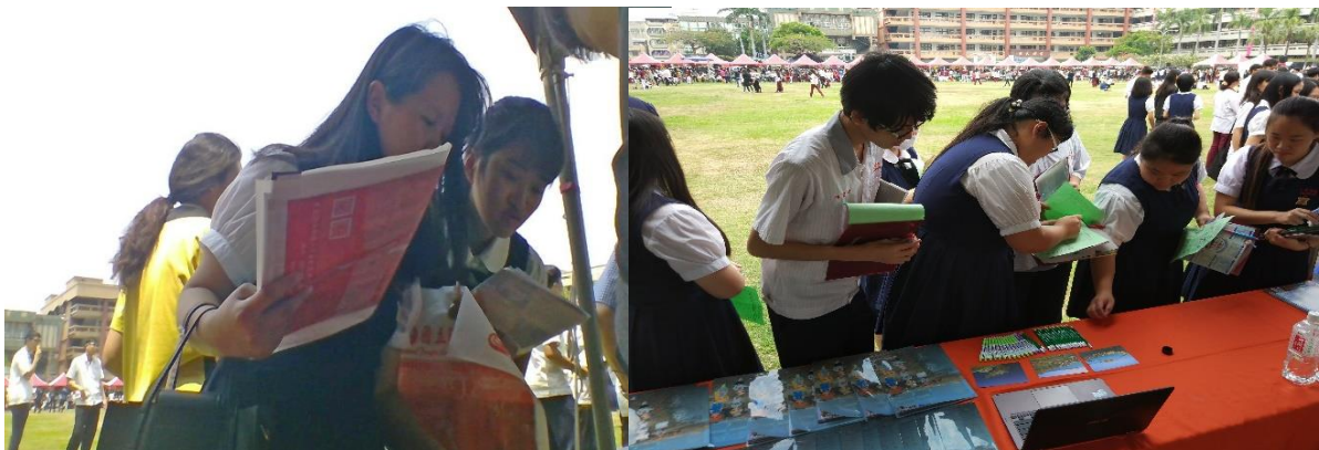
圖：高雄三信家商升學博覽會

107 年（4 月 11 日）學務處 邀請國稅局校園稅務宣導專題 講座，學生出席踴躍。（學務處）