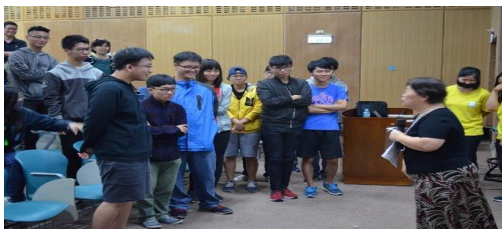
圖:同學參與活動踴躍

107 年（4 月 19 日）本校學務處課外活動組舉辦社團幹部專題講座以服務學習提升溝通力。（學務處）