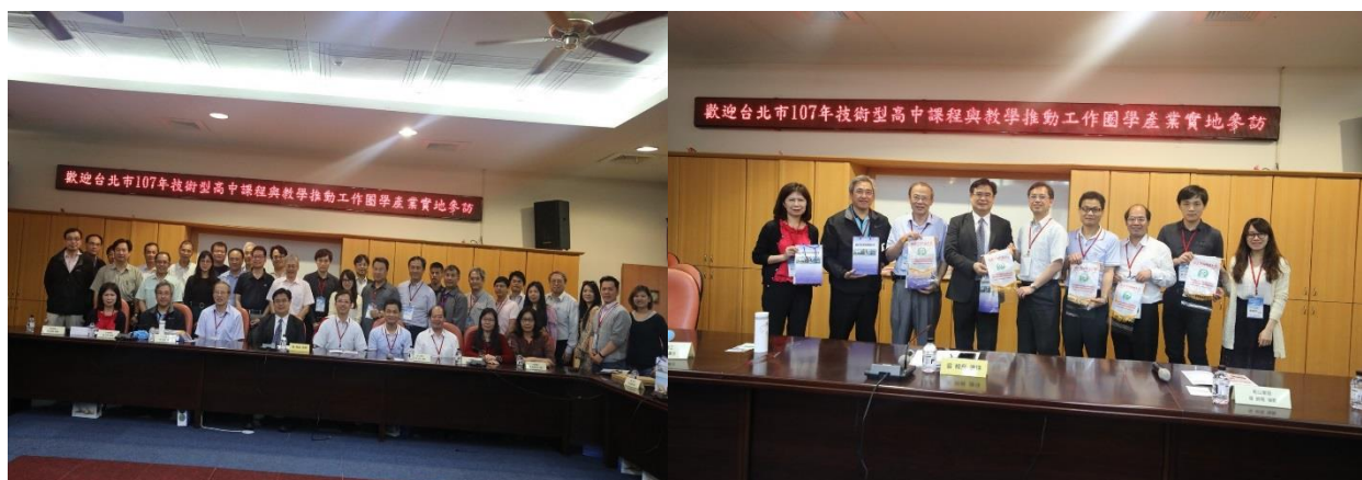
圖：校長與會來賓合影

107 年（4 月 19 日）臺北市 107 年技術型高中課程與教學推動工作圈於 19 日蒞臨本校產業實地參訪。(教務處)