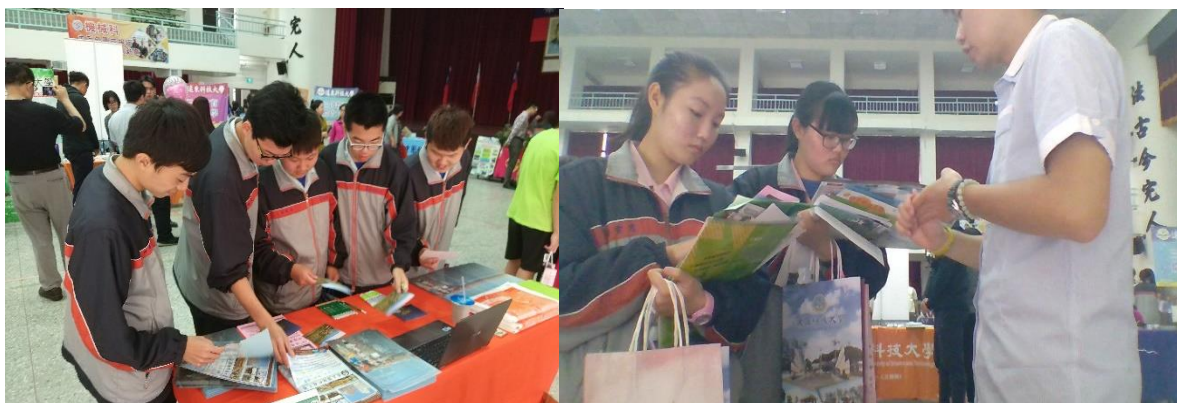
圖：國立虎尾農工升學博覽會