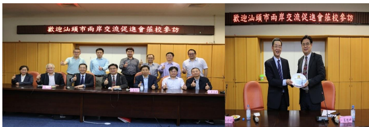
圖：汕頭市兩岸交流促進會蒞臨本校參訪

107 年(4 月 12 日)本校汕頭市兩岸交流促進會蒞臨本校參訪，進行針對多方意見交流。(研發處)