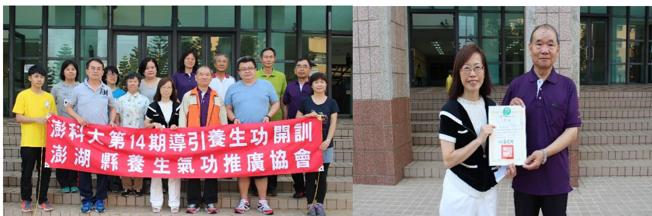
圖：推廣教育非學分班「導引養生功保健推廣班第 14 期」開訓

107 年（4 月 14 日）本校進修推廣部辦理執行「導引養生功保健推廣班第 14 期（推廣教育非學分班）」開訓全體合影。（進修推廣部）