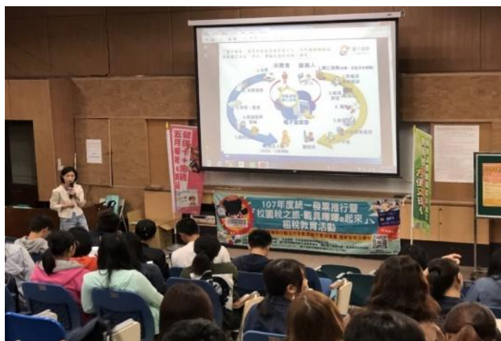
圖：學生參與校園稅務宣導

107 年（4 月 11 日）學務處 邀請國稅局校園稅務宣導專題 講座，學生出席踴躍。（學務處）