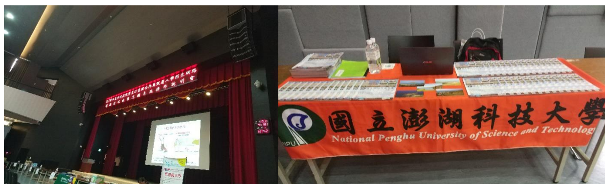
圖:北中南三區繁星說明會升學博覽會

107 年(4 月 12-16 日)本校進行北中南三區繁星說明會升學博覽會，零距離學生與教師接觸，並宣導各科系與教學理念，拓展學校知名度。(教務處)