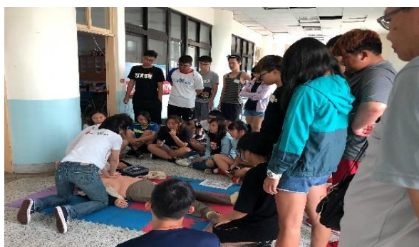
圖：同學參與活動踴躍

107 年（4 月 28-29 日）本校健康中心 4/28-29 針對全校師生辦理紅十字會急救員訓練，共計 43 人參加。（學務處）