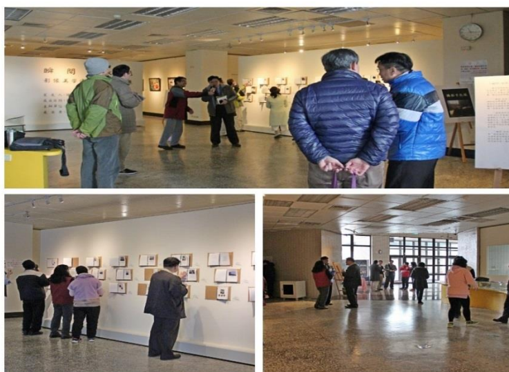
圖:「瞬間・永恆」—影像美學通識課程成果展

107 年（2 月 8 日）本校校長偕同一級主管至藝文中心觀賞「瞬間・永恆」—影像美學通識課程成果展，對學生影像紀錄 21 天生活經歷，所展現的成果，讚賞有加。（圖資館）