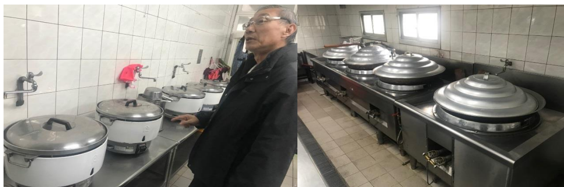
圖: 國立澎湖高級海事水產職業學校學生餐廳

107 年（2 月 26 日）本校校長與相關單位主管，前往國立澎湖水產職業學校，了解學生餐廳的建置，作為未來設置本校學生餐廳規劃概念。(學務處)