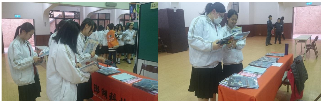
圖:臺北靜修女中升學博覽會

107 年（2 月 23 日）本校參加臺北靜修女中升學博覽會，零距離學生與教師接觸，並宣導本校各科系與教學理念，拓展學校知名度。(教務處)