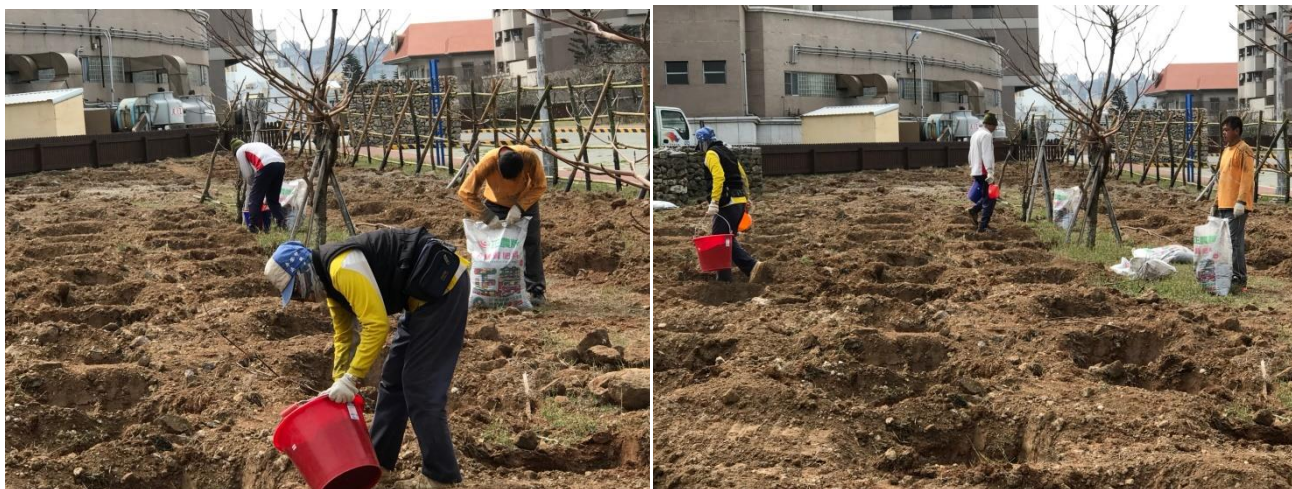
圖:本校舉辦 107 年澎湖縣植樹月活動，進行樹穴開挖、護籬建置之準備

籬建置。活動當天邀請澎湖縣民與全校師生眷屬共同參與，共同植栽綠化校園。 (總務處)