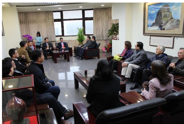
圖:澎科大主管拜訪聯大校長室

107 年（2 月 8 日）本校校長偕同一級主管至藝文中心觀賞「瞬間・永恆」—影像美學通識課程成果展，對學生影像紀錄 21 天生活經歷，所展現的成果，讚賞有加。（圖資館）