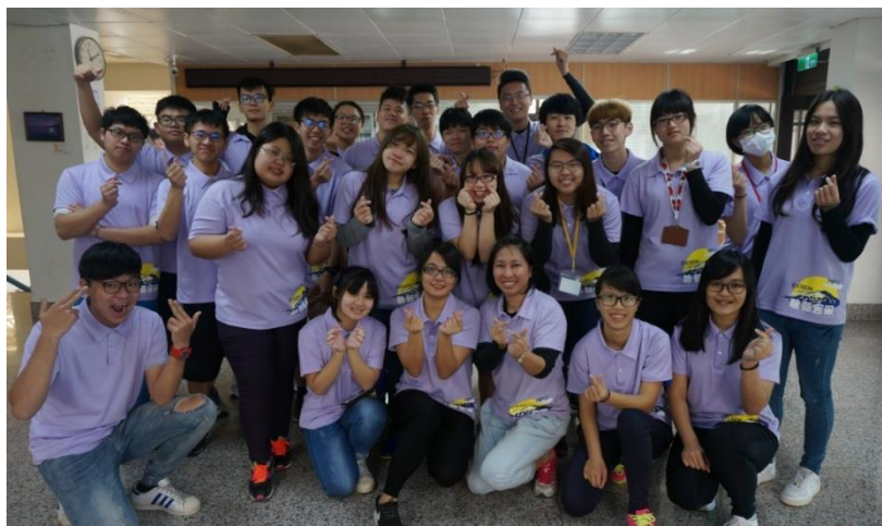
圖:學生幹部全體合照

107 年（2 月 24 日）本校學生宿舍開宿。新學期學生宿舍幹部安排辦理期初活動、幹部甄選、文藝活動、母親節感恩活動、整潔比賽、趣味競賽，請全校同學踴躍參與。(學務處)