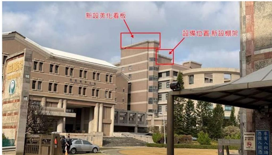
附件一 三家電信公司於圖資大樓設置 FRP 天線美化看板、棚架之位置及示意照片