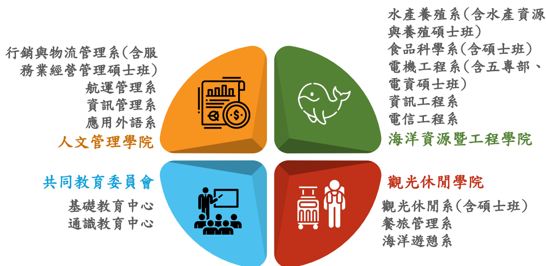
圖 1-2 國立澎湖科技大學教學組織架構