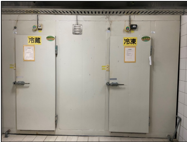
組合式冷凍冷藏櫃