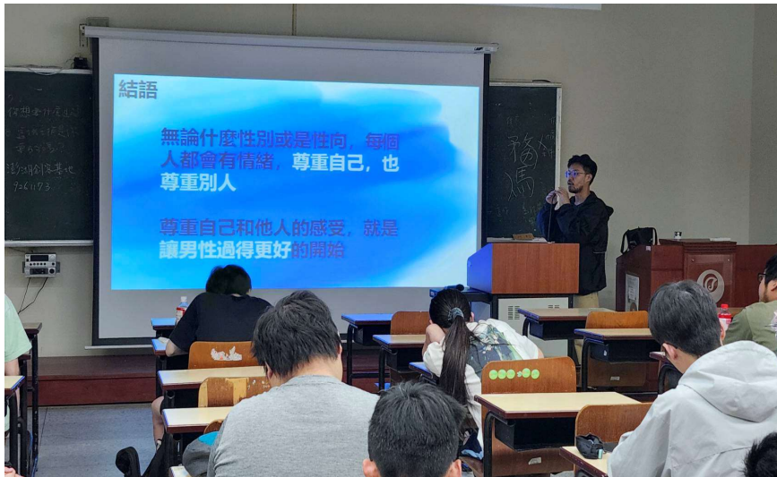
照片說明： 講座尾聲，講師宣導性別平等及相互尊重的重要