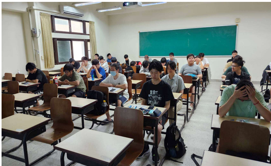
照片說明： 講師帶領同學體驗正念活動，透過靜坐觀息練習釋放情緒壓力