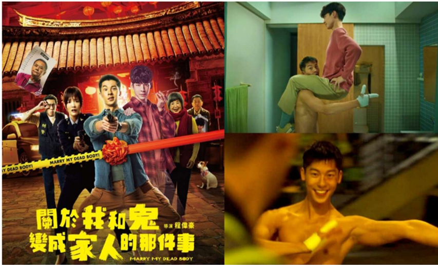
照片說明： 影片欣賞與反思 寫作《關於我和鬼 變成家人的那件事》