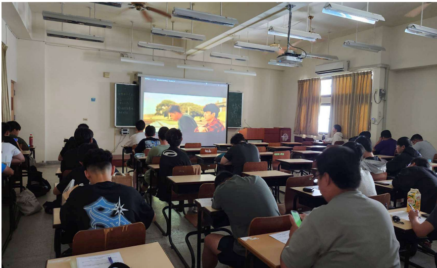
照片說明： 影片欣賞與反思 寫作《關於我和鬼 變成家人的那件事》