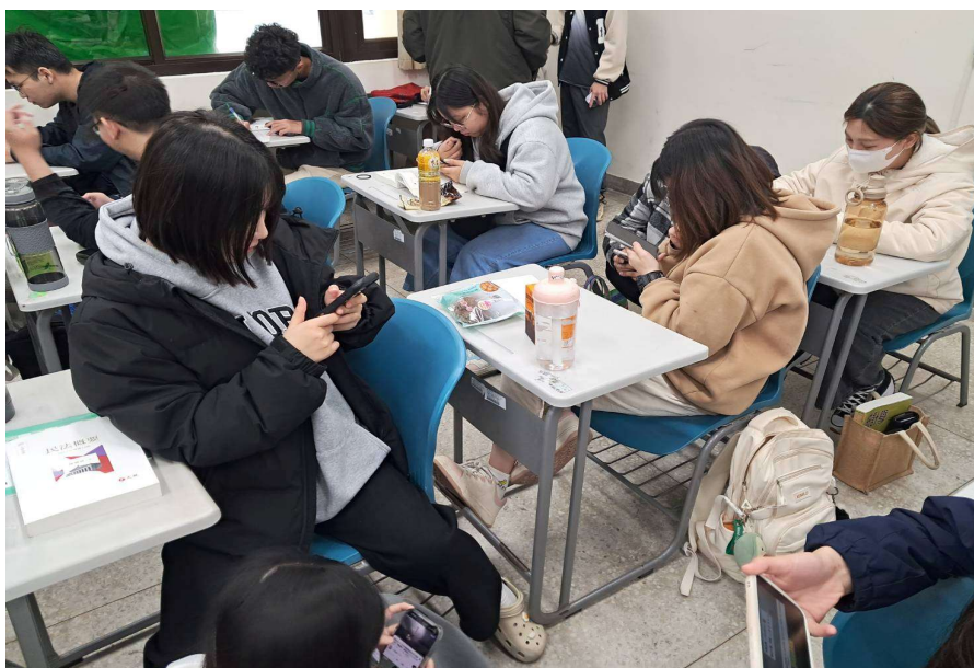
照片說明： 114年03月10日 學生討論狀況