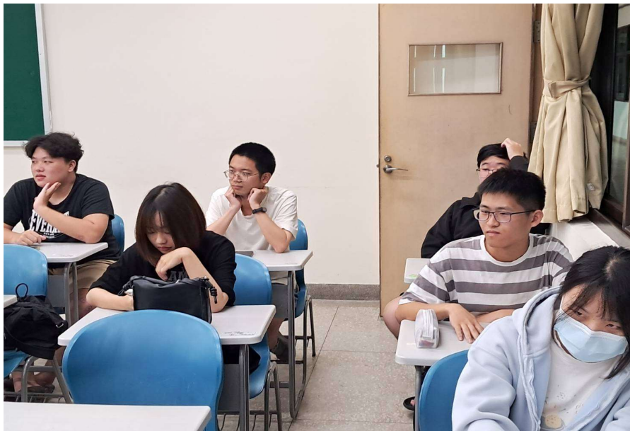
照片說明： 114年04月30日 同學上課情況