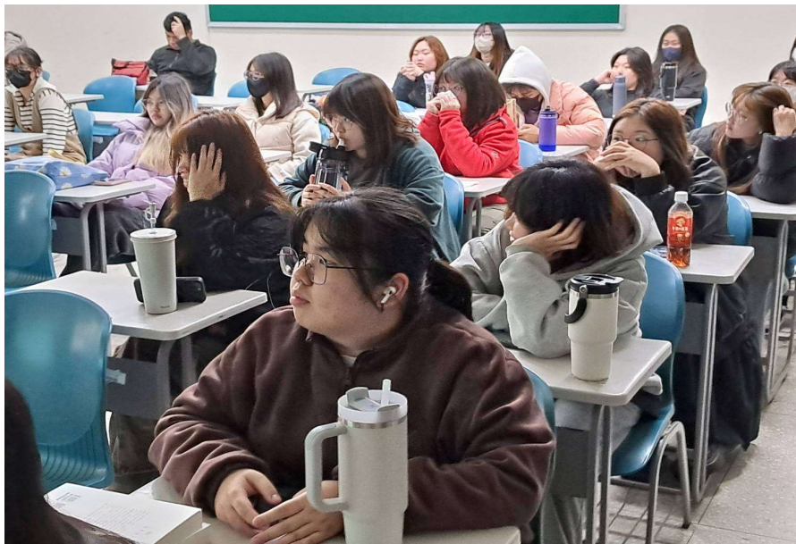
照片說明： 114年03月10日 學生上課情況