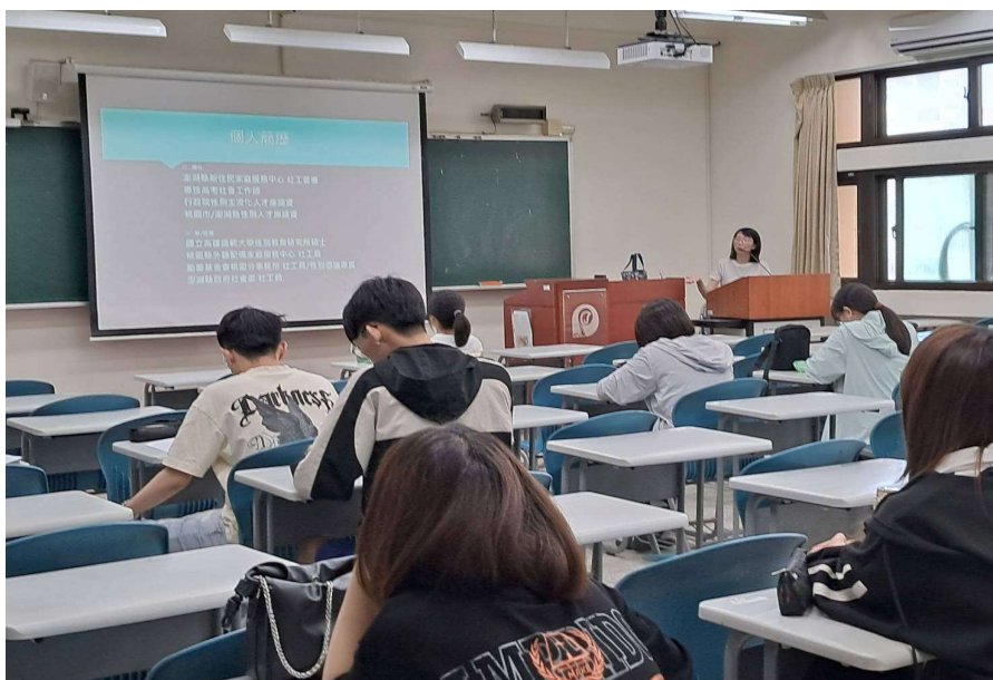
照片說明： 114年04月30日 同學上課情況