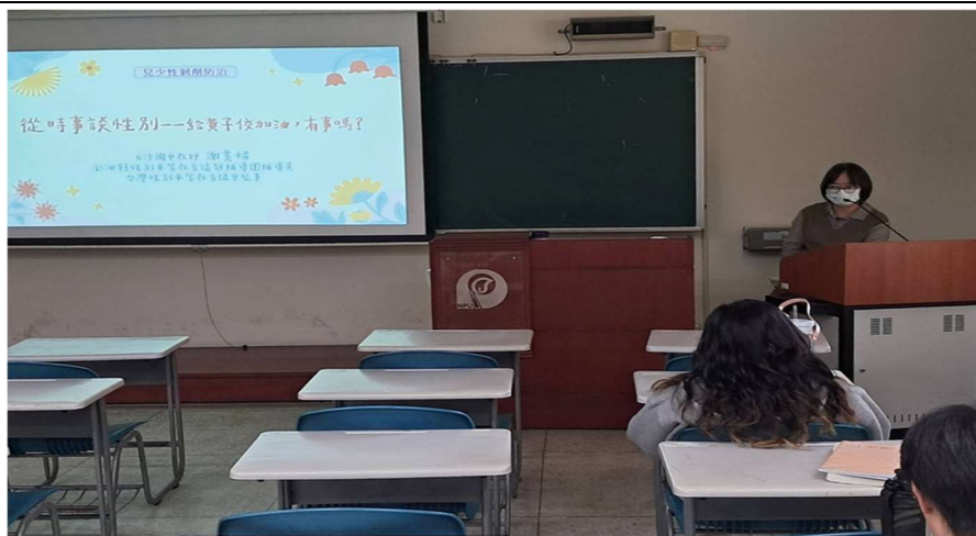
照片說明： 114年03月10日 講師授課