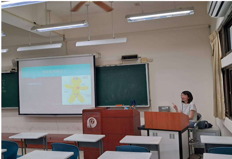
照片說明： 114年04月30日 講師授課