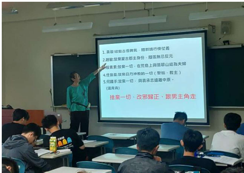
照片說明： 第三次上課