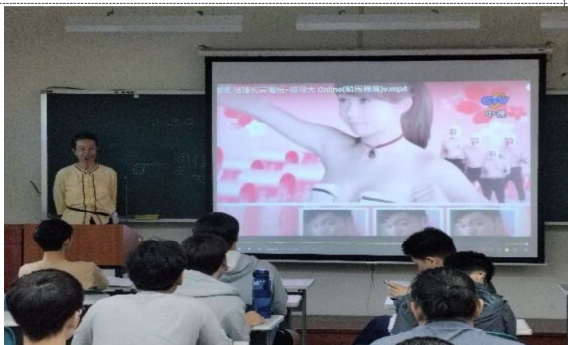
照片說明： 第二次上課，觀看影片