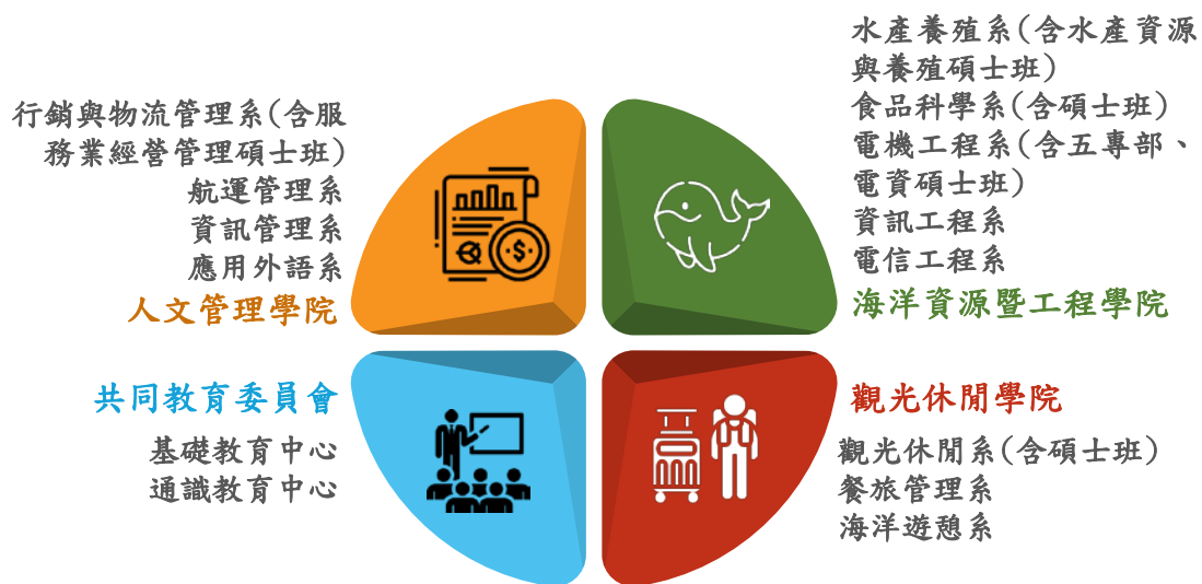
圖 1-2 國立澎湖科技大學教學組織架構