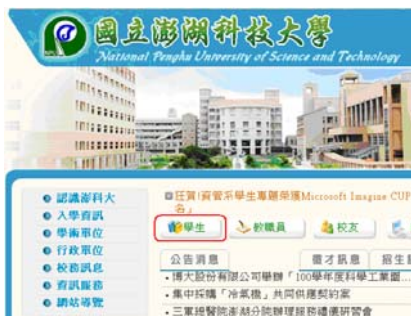
(教職員工)點選『學生』