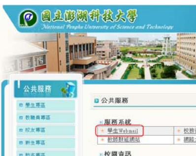
點選『學生 Web Mail』