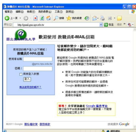
教職員信箱登入畫面