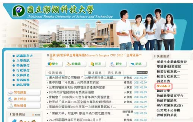
(教職員工)點選 Web Mail

2.澎湖科技大學首頁，(教職員工)點選 Web Mail 進入，學生點選『學生專區』。