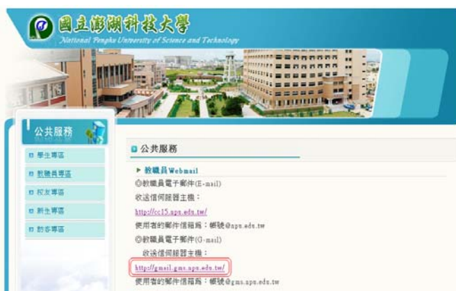
點選 http://gmail.gms.npu.edu.tw 連結