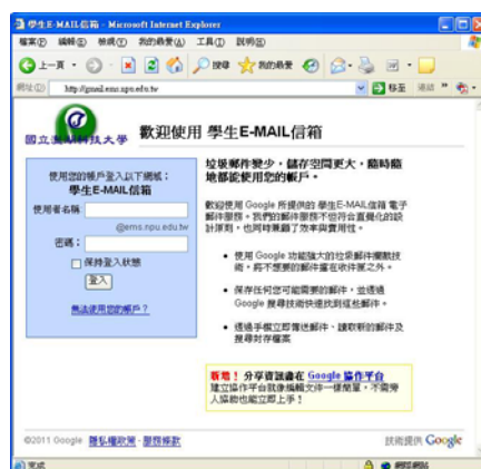
學生信箱登入畫面