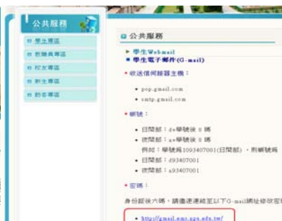
點選 http://gmail.ems.npu.edu.tw 連結